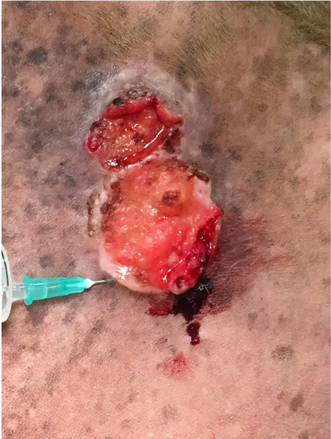
Eerst wordt de tumor geïnjecteerd met therapeuticum.